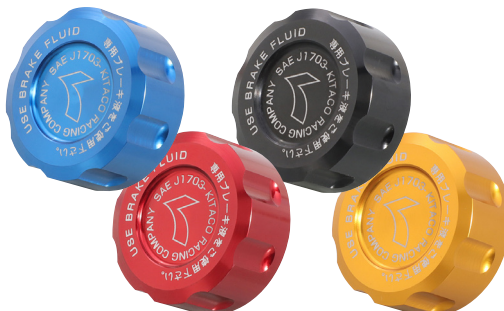
K-CONより マスターシリンダーキャップ 好評発売中